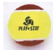
24 Bolas de Mini Ténis